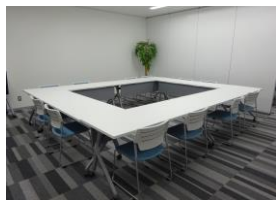
レセプションルーム A