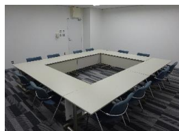
レセプションルーム A